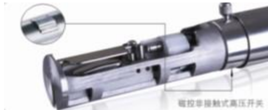
磁控非接触式高压开关