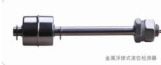
金属浮球式液位检测器

独创的墨水黏度检测和液位检测技术，保证机器高清晰度打印质量的同时，比同类机器更多的试用抗迁移墨水和黄色墨水